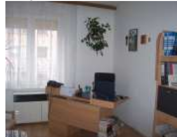
Prestavba administratívnych miestností