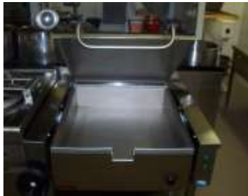
Výmena časti kuchynskej technológie stravovacieho úseku