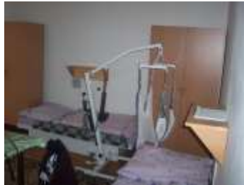
Investícia do technologického vybavovania DD v Lekárovciach