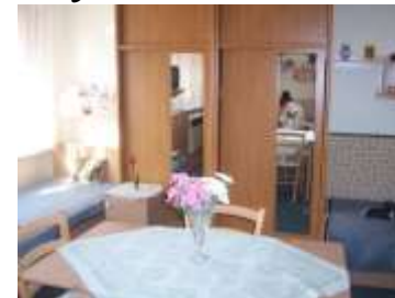
Výmena nábytku vo všetkých ubytovacích jednotkách