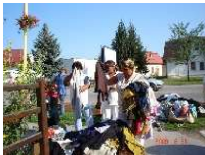
25.8.2009 - CHARITATIVNA ČINNOSŤ-ROZDÁVANIE ŠATSTVA