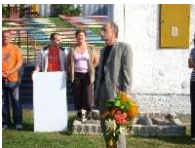
22.9.2009 - OTVORENIE SKANZENU „CESTY,, VO VEĽKÝCH KAPUŠANOCH