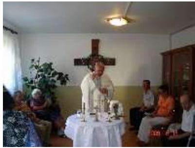
19.8.2009 - GRECKOKATOLICKA OMŠA V ZARIADENI DD