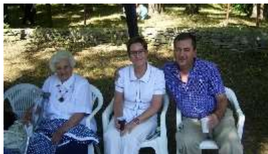
30.8.2009 - XIII. FOLKLÓRNÝ FESTÍVAL MEDZIBODROŽIA