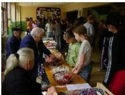
1.6.2009 - PREZENTÁCIA ĽUDOVÝCH REMESIEL ZŠ ČIERNÁ NAD TISOU