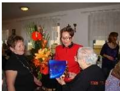
25.11.2009 - OSLAVA KATARÍNY