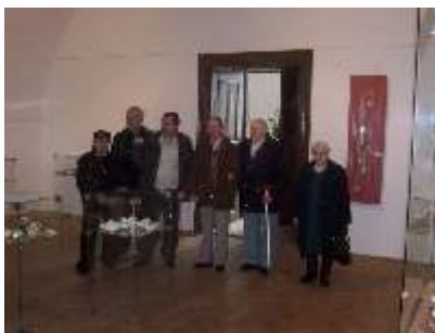
31.3.2009 - "KARPATSKÁ KRASLICA"- VÝSTAVA VO VLASTIVEDNOM MÚZEU V HUMENNOM