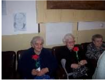
8.3.2009 - OSLAVA MDŽ