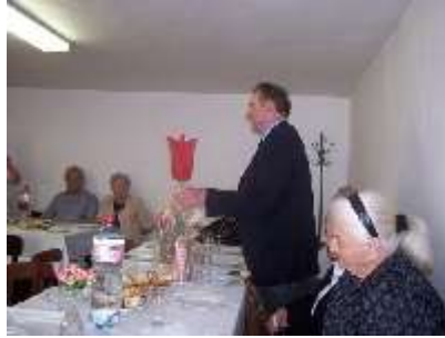
11.05.2009 - OSLAVA DŇA MATIEK V KLUBE DÔCHODCOV VO VEĽKÝCH KAPUŠANOCH