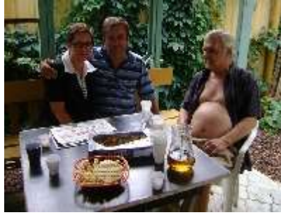
13.8.2009 - PIKNIK V AREALI DD