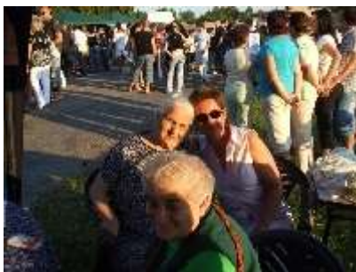
12.7.2009- PREZENTÁCIA ĽUDOVÝCH REMESIEL - FESTIVÁL PTRUKŠA