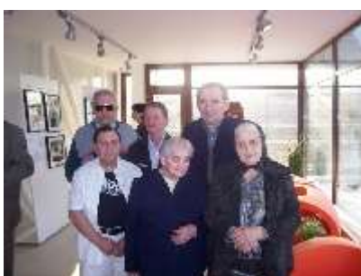
7.4.2009 - OTVORENIE VÝSTAVY " VÍTEJTE V ČESKU" V TURISTICKOM CENTRE V.KAPUŠANY