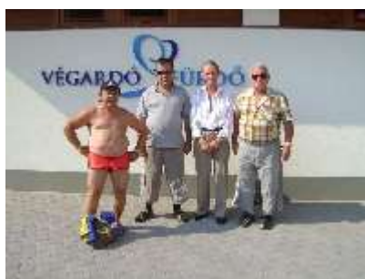
26.8.2009 - KÚPALISKO ARDO