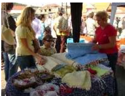
19.9.2009 - VINOBRANECKÉ SLÁVNOSTI KRÁLOVSKÝ CHLMEC