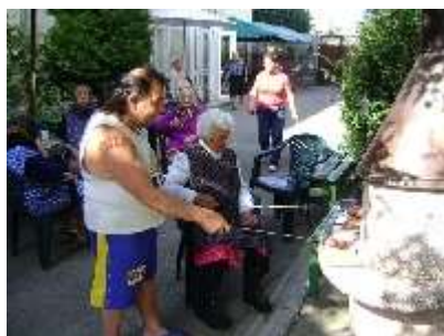
9.9.2009 - PÍKNIK V AREALI DD - OPEKANIE SLANINÝ