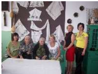
19.05.2009 - PREZENTÁCIA ĽUDOVÝCH REMESIEL V ZŠ KRÁĽOVSKÝ CHLMEC