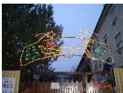
10.12.2009 - VIANOČNÝ AREÁL DOMOVA, N.O.