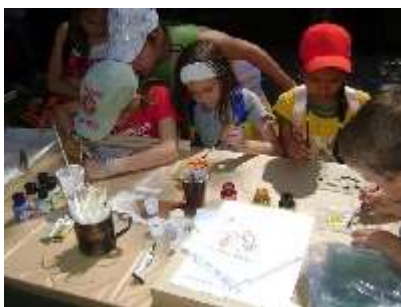
19.6.2009 - PREZENTÁCIA ĽUDOVÝCH REMESIEL- DEN DETI - ZŠ MADARSKÁ V. KAPUŠANY