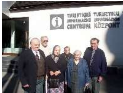
13.05.2009 - OTVORENIE VÝSTAVY " ŽIVOTVORBA A BEZBREHOŠŤ UMENIA " V TIC