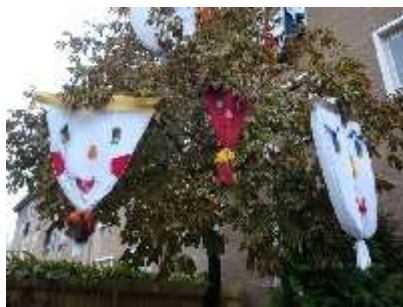
23.-25.10.2009 - JESENNÝ VEĽKOKAPUŠIANSKÝ JARMOK