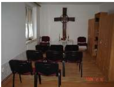
14.12.2009 - SLÁVNOSTNÉ ODOVZDANIE KAPLNKY V DD