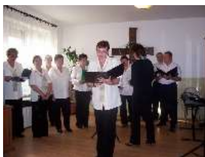
19.05.2009 - VÝSTÚPENIE SPEVOKOLU LATORIČAN A ŽIAKOV ĽŠU - KU DŇU MATIEK