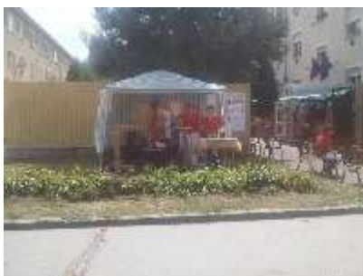
7-8.8.09 - LETNÝ VEĽKOKAPUŠĽANSKÝ JARMOK