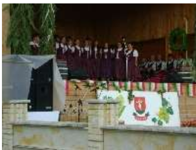
13.9.2009 - VINOBRANECKÉ SLÁVNOSTI MALÁ TRŤA