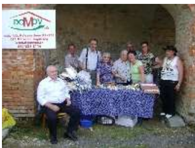
28.6.2009 - TOKAJSKÝ FESTIVAL BORŠA