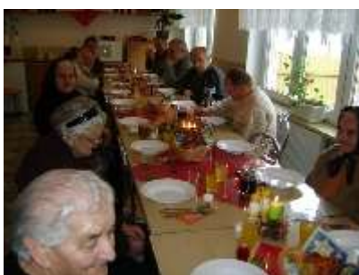
24.12.2009 - VIANOCE V DD