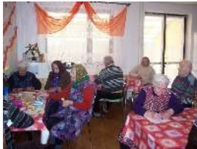
19.3.2009 - VEĽKONOČNÉ PRÍPRAVY V DD LEKÁROVCE