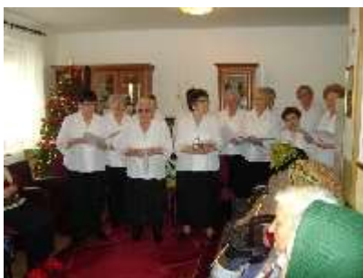
21.12.2009 - KLUB DŮCHODCOV VEÍKÉ KAPUŠANY V ZARIADENÍ