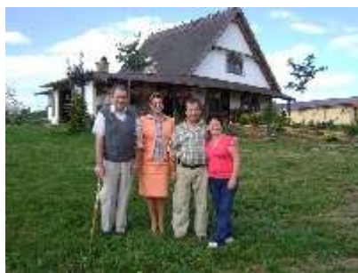
8.9.2009 - VÝLET OBYVATEĽOV DOMOVA, N.O.