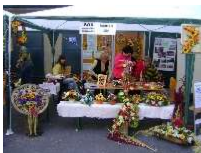
10.9.2009 - PREZENTÁCIA VÝROBKOV KLIENTOV DOMOVA, N.O. - VÝSTAVA KSK