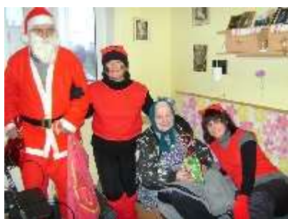
4.12.2009 - MIKULÁŠSKÝ VEČIEROK V DD