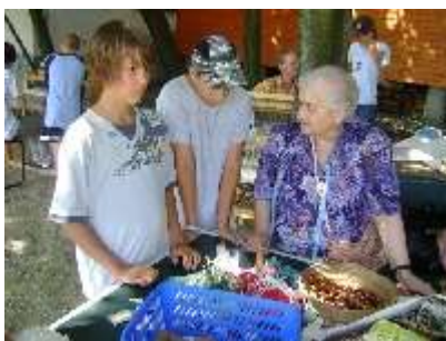
23.7.2009 - LETNÝ TÁBOR HATFA VÍNIČKÝ - PREZENTÁCIA ĽUDOVÝCH REMESIEL