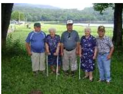
6.7.2009 - TURISTICKÝ VÝLET OBYVATEĽOV NA VÍNNÉ JAZERO