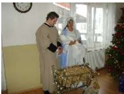
22.12.2009 - VIANOČNÉ VÝSTÚPENIE ŠTUDENTOV SOŠ