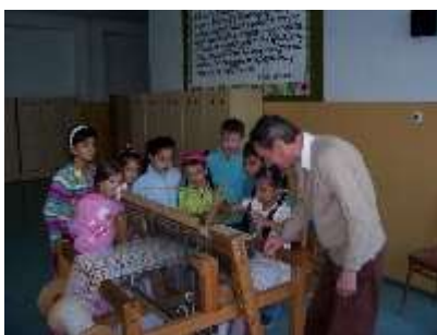
21.04.2009 - PREZENTÁCIA ĽUDOVÝCH REMESIEL NA ZŠ